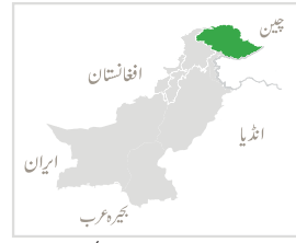
مہرب شہزادہ ریاض پی پی اے ایف۔ جی آئی ایس لیبارٹری