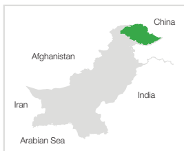
Processed & Prepared by: PPAF GIS Laboratory